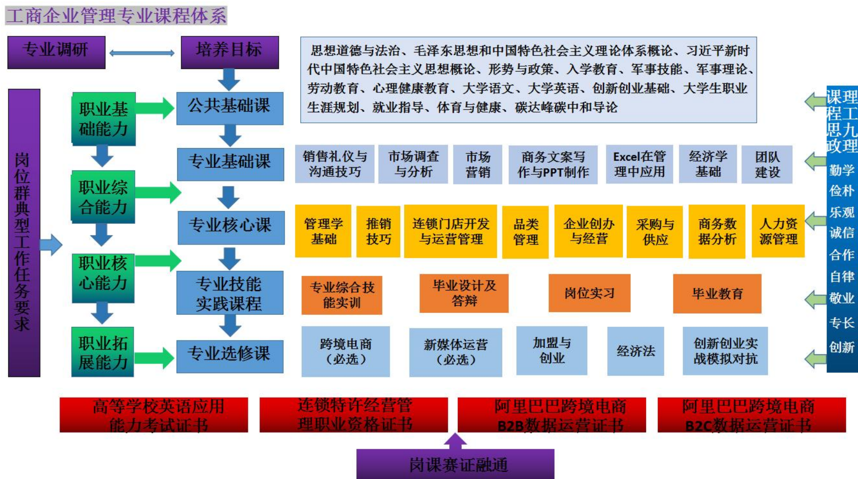
图 1 课程体系